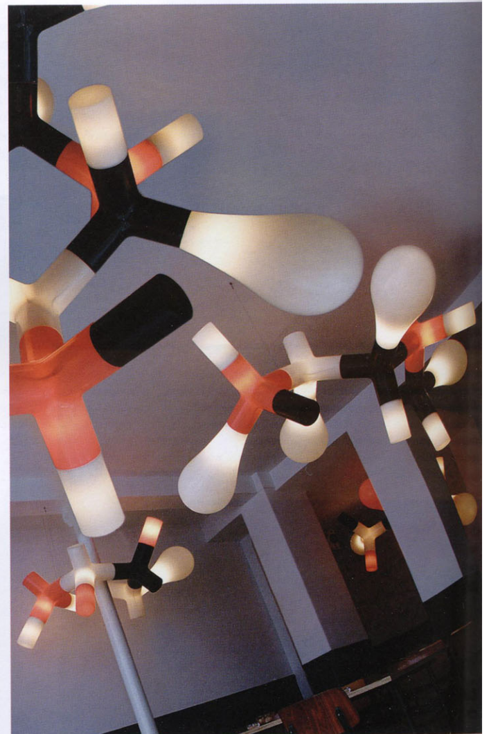
Sistema di illuminazione serie Genetic di Domo-Modo, design Douglas Mont.